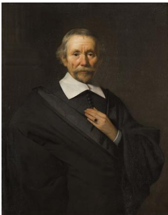
Caesar van Everdingen. Omakuva , 1670. Stedelijk Museum Alkmaar

Helmikuussa Sinebrychoffin taidemuseossa avataan vuoden kansainvälinen päänäyttely Caesar van Everdingen – Siveltimen mestari Rembrandtin aikaan . Caesar van Everdingen (1616/1617–1678) oli aikalaistensa suuresti arvostama mestari. Hän jäi kuitenkin myöhemmin, lukuisten muiden taiteilijoiden tavoin, dramaattisempaa tyylisuuntaa edustavan Rembrandtin varjoon. Caesar van Everdingenin tuotanto, jota asiantuntijat pitävät yhtenä 1600-luvun parhaista, on nyt koottu yhteen ensimmäistä kertaa.