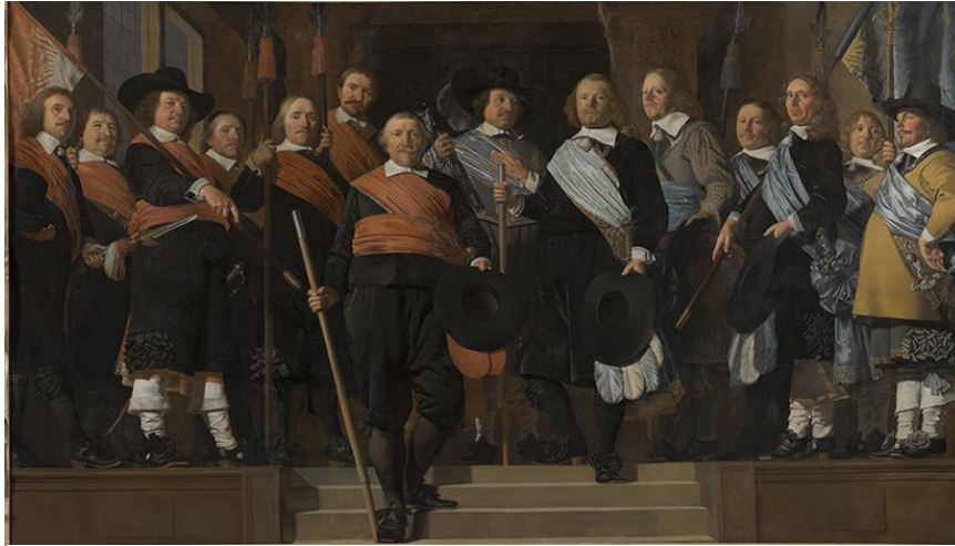
Caesar van Everdingen: Alkmaarin vanhan porvarikaartin upseereita ja lipunkantajia. 1657. Stedelijk Museum Alkmaar